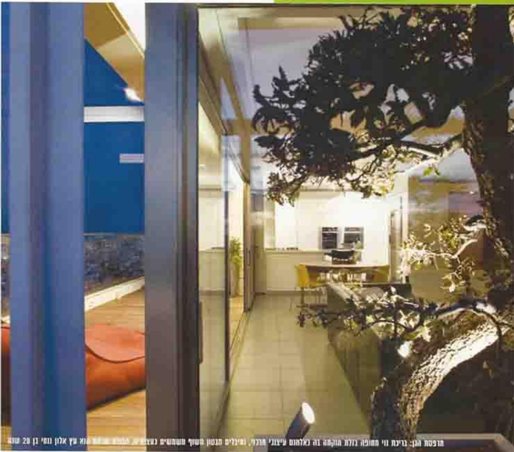
חופסת הגן: גרימת ווי מחופה בלול הוקמה זה בלחונם עיצובי חרולי, וייללים מבטון חשוף משמשים בעיצוב. מבטון חשוף הוא עץ אלון נומי בן 20 טונות

הוא הפשטות. כדי ליצור סוג של פשטות בעיצוב נדרשת דייקנות רבה בבחירת החומרים, במינון שלהם, במרטים ובאופן הביצוע" ...בחרתי בחומרים בעלי אופי "חזק" כמו עץ תיק, ואבני בזלת, הקירות נצבעו בגוון ירוק זית - כל אלו יצרו הרמוניה עם האור הטבעי והנוף המרשים החודרים מבעד לחלונות הגדולים של הבית. נוצרו שקט ורוגע מאריכי ימים המספקים רקע ניטרלי לכיטוי אישי של הדיירים" נחרית הריהוט נעשתה על ידי כהן בלטמן כעבודת אצורות, כל פריט נבחר בקפידה וחרום להשלמת המראה המוקפד של הבית