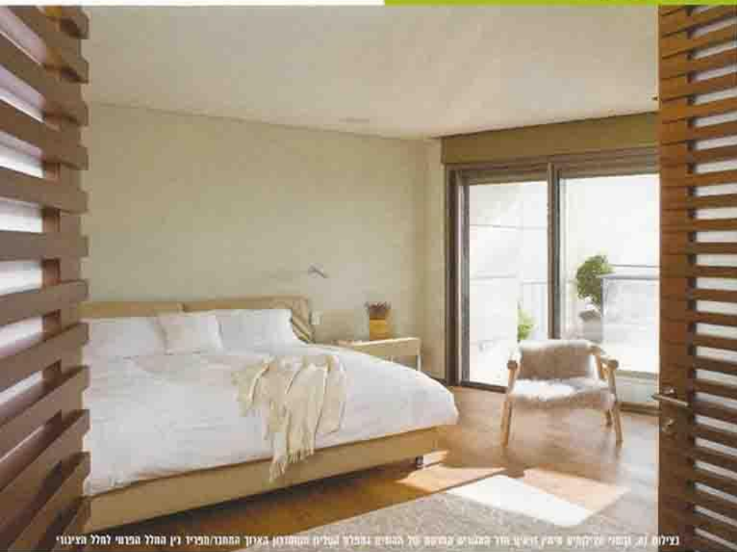
עיצוב: אריאל ורדי. חדר המגורים ממוקם על הפנים ומכיל טליון המסדרון בצורך המחבר מפריד בין החלל הפרטי לחלל הציבורי

"כדי ליצור סוג של משטוח בעיצוב נדרשת דיוקנות רבה בבחירת החומרים במיון שלהם. בפרטים ובאופן הביצוע"