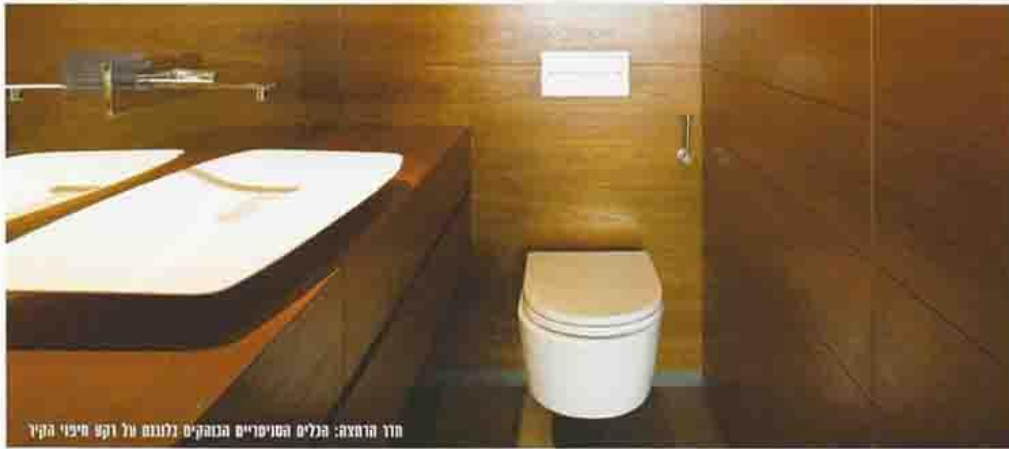
חדר הרחצה: הכלים הטניסיריים הנוכחיים נלגו על רקע חיצוני הקיר