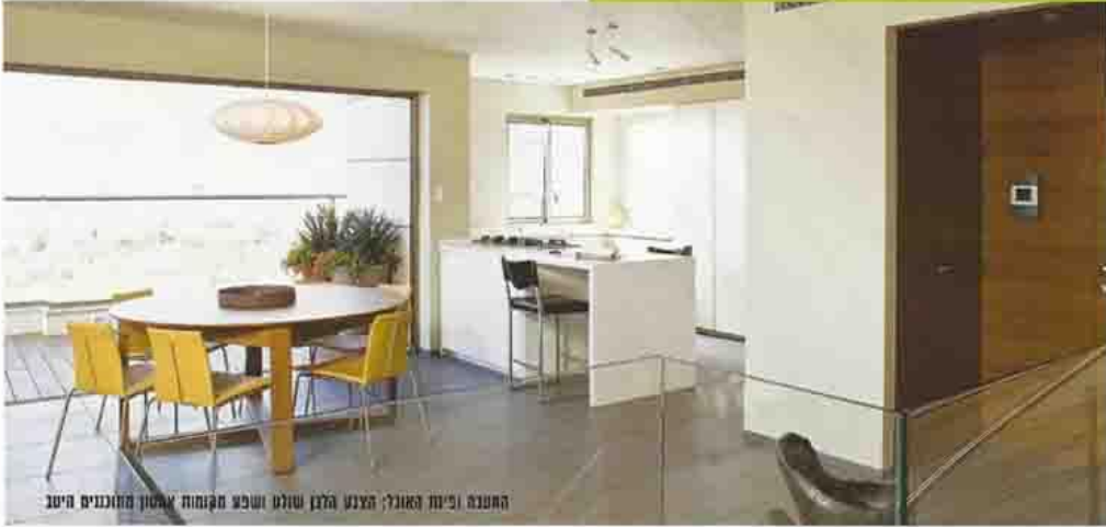
החטבה וכיור האוכל; הצבע הלבן שולט ושופע מקומות ארסון המוכרזים היטב