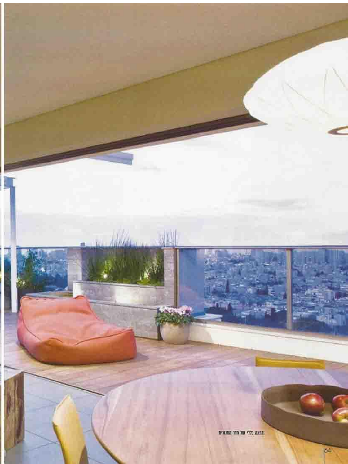
הואה בללי של סודר המנויים