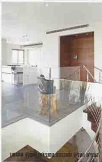
מפעל העלון והחודרת הפנימית ליקנין הבלטמן

הוא הפשטות. כדי ליצור סוג של פשטות בעיצוב נדרשת דייקנות רבה בבחירת החומרים, במינון שלהם, במרטים ובאופן הביצוע" ...בחרתי בחומרים בעלי אופי "חזק" כמו עץ תיק, ואבני בזלת, הקירות נצבעו בגוון ירוק זית - כל אלו יצרו הרמוניה עם האור הטבעי והנוף המרשים החודרים מבעד לחלונות הגדולים של הבית. נוצרו שקט ורוגע מאריכי ימים המספקים רקע ניטרלי לכיטוי אישי של הדיירים" נחרית הריהוט נעשתה על ידי כהן בלטמן כעבודת אצורות, כל פריט נבחר בקפידה וחרום להשלמת המראה המוקפד של הבית