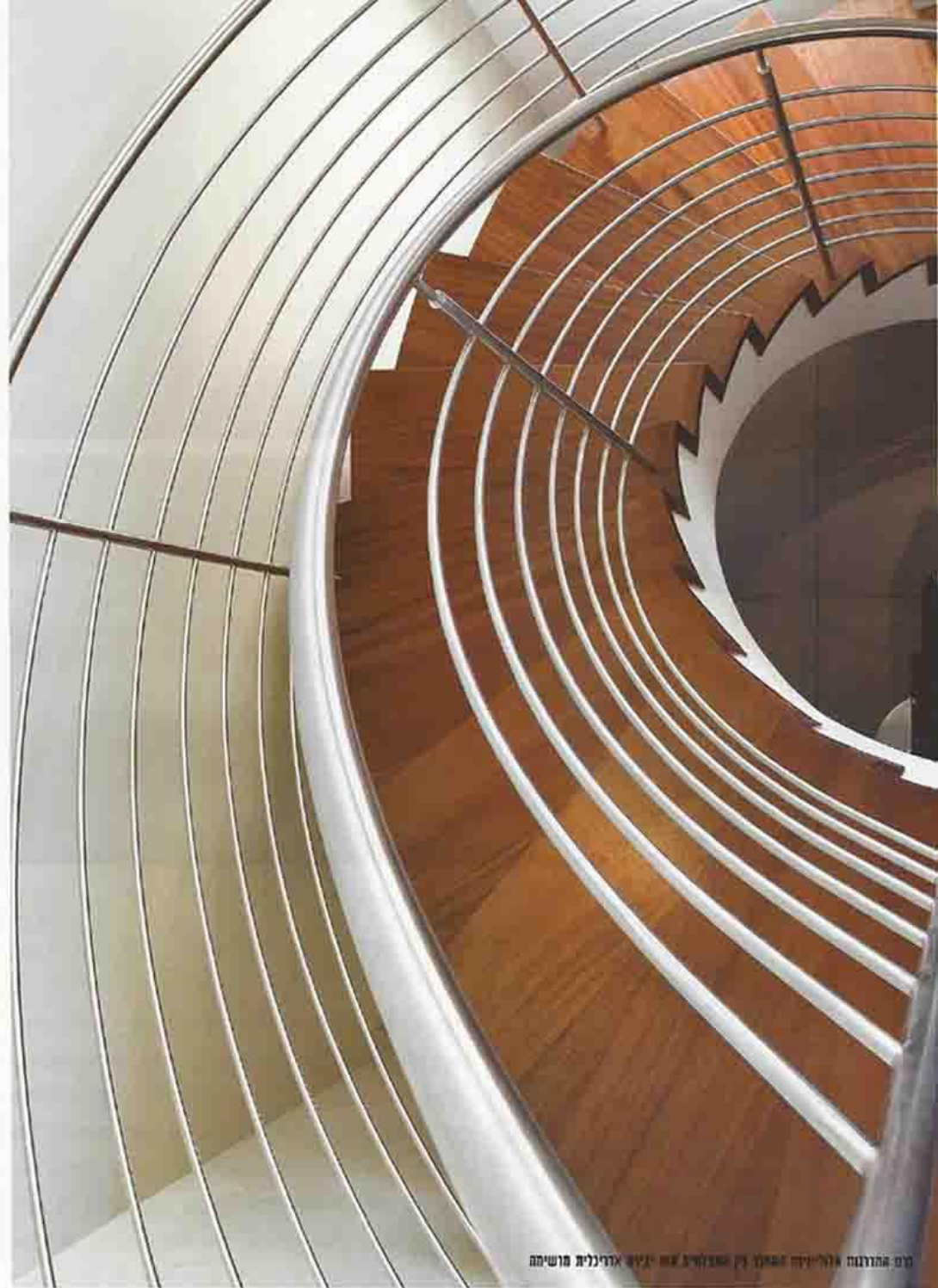
גם המדרגות הלולייניות האלו הן שפועלות עם גישה אדריכלית מרשימה