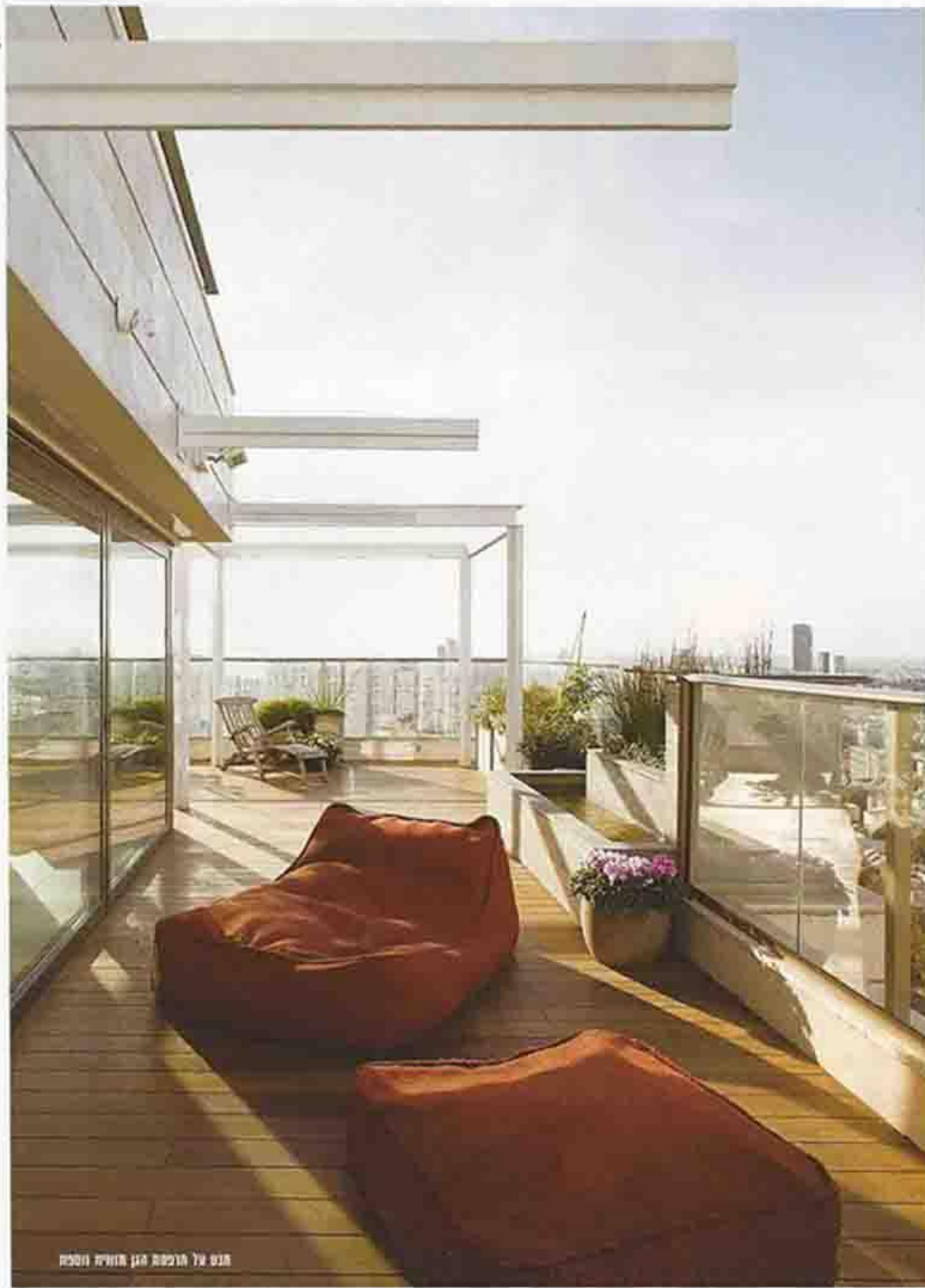
חום על חופסת הגן חוזרת נוספת