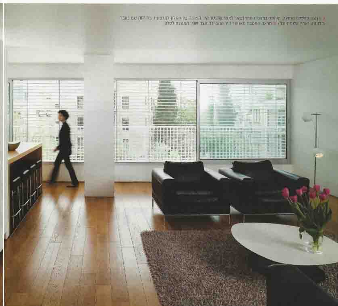
הקצב והחלל החדש, הנוצח במרחב המודרני (מצד ימין) שחשבו קיר הפרידה בין הסלון למטבח שיהיה עם געבר (הצד שמאל) (המקום אלומיניום) 3. המטבח שמתבטח מאחורי קיר הפרידה בצד שמאל המטבח לסלון