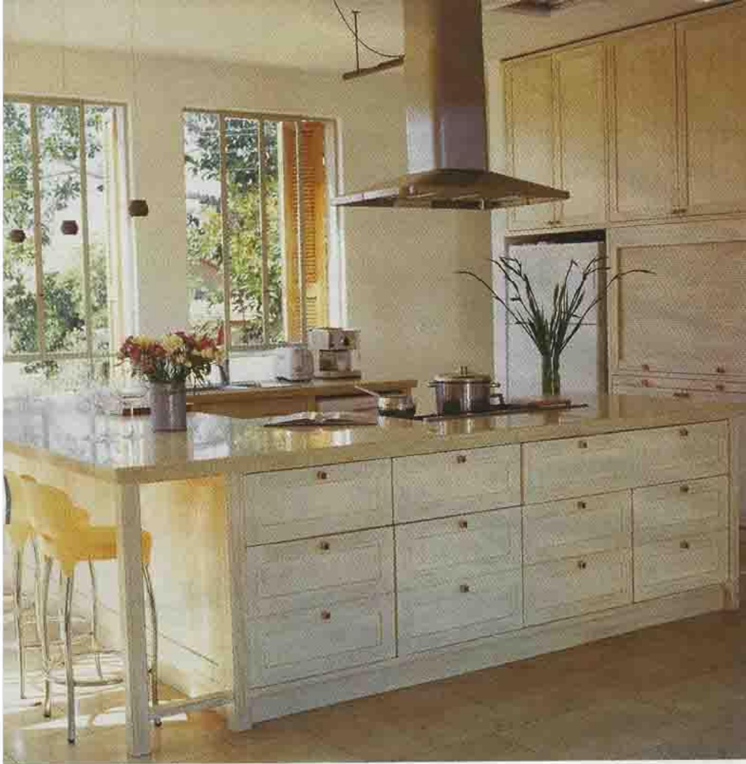
המטבח, איצטודיו מעץ מיפיל בבני דלת בסביבות נטות של ווש בנן שמנה, וזרז בנזוכו אחתה החחורים, שולחן, כור וכרס