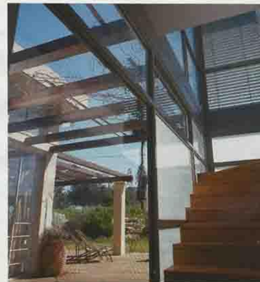
מיניון למעלה, בגד כיוון השעון: הכניסה לבית, פינת האוכל, מנס המרפסת אל המטבח, המדרגות המובילות למרתח החורים

האורחים. על ארונות עליונים ויתרו האדריכלית ובני הזוג רונבלט בשמחה, וארונות תחתונים מספקים לחלוטין את צרכי המשפחה. אי עבודה טרשים מעץ מייפל, שנצבע דיגית בטכניקות נסות של ווש בנן שמנה, נבנה כדי לשמח את וזר רונבלט, שאוהב מאוד לבישל ובו זמנית לרוץ בעיניו ריוטא עם הילדים והחברים. חדר שירות ומוזה עומדים לרשותו במגנים, גן ירק עם גידולי העונה בחוץ, ונותר רק להכות למעדנים. אנחנו בעיקר במטבח ובפינת המשפחה, אמרת שירלי רונבלט. "המבנה גדול, אבל במקום לבנות יותר חדרים, החלטנו לצמצם כמות לטובת מרחב פתוח, מבחינתי זה לא בזבז מקום. אני אוהבת מרחבים פתוחים, שנפלא לראות בהם. עשינו פה את מסיבת הולדת הבת הצעירה וחתונת אבי, והיה מקסים. בחוץ אנחנו לא מצטופפים בחללים קטנים,