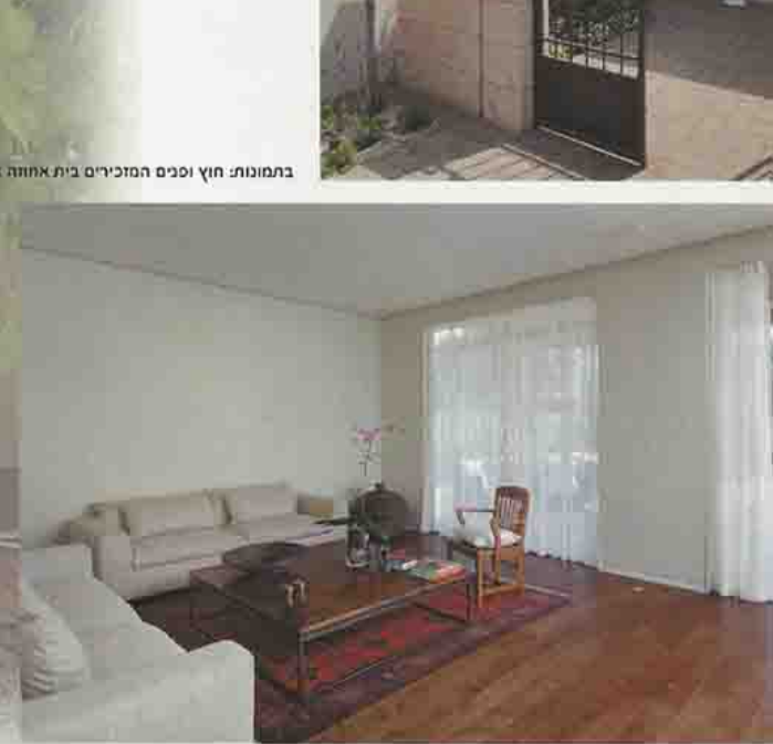
בתמונות: חוף ופיס המכירים בית אחתה איטלקי