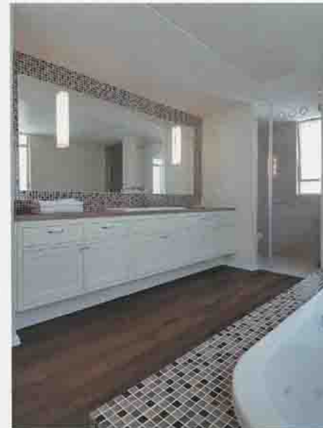
בתמונת מראה "לופטי" בחדר שינה הורים וחדר הרחצה

הקומה השנייה על ידי מבואה וחלל המדרגות המתפקד כגשר הפרדה בין אזורי השינה של ההורים וילדיהם. ייחודו של חדר השינה של ההורים הוא תקרת עץ נבונה צבועה לבן בנימור ווש, המשווה לו מראה לופטי רומנטי. ארון דו-צדדי הניצב במרכזו מפריד בין אזור השינה לכניסה ומייצר אינטימיות בחלל הגדול יחסית. כאמור, פתרונות אחסון היו אחד הדגשים החשובים בתכנון הבית, והכניסה לחדר משמשת כחדר ארוזות קטנה. כל מפתני החלונות בבית מחופים בזלת וכמותם גם מפתני הדלתות הפתוחים, מה שמסייע להפריד